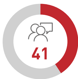
Total de entrevistas realizadas

Originalmente estaban pautadas 14 entrevistas y 14 cuestionarios (puntos focales de gobiernos, de organizaciones de empleadores y de trabajadores). En el transcurso del estudio se hizo evidente la necesidad de ampliar el universo de entrevistados y se incorporaron representantes de áreas gubernamentales (representantes de organizaciones sindicales, funcionarios de Salud y Seguridad en el Trabajo, inspectores), de empleadores y de trabajadores que fueron seleccionados con el método bola de nieve. En consecuencia, el número de entrevistas fue mayor del pautado inicialmente. Todas las entrevistas y comunicaciones se realizaron a través de medios virtuales: Zoom, Skype, videollamadas, teleconferencias y correo electrónico.